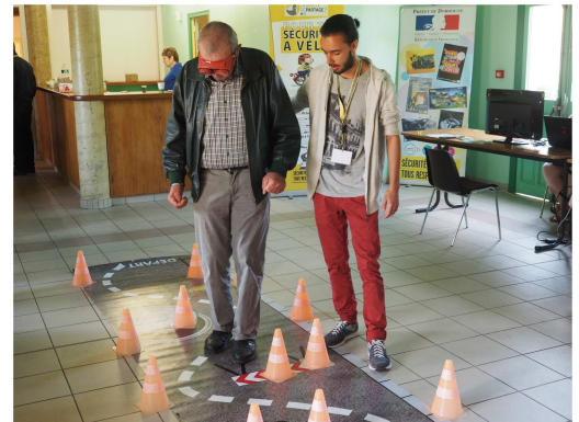
Atelier prévention du risque alcool/stupéfiants lors du rallye senior