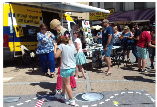
Stand Sécurité Routière lors de la fête du couteau de Nontron

- 17 et 25 octobre 2017, Lycée de Thiviers, élèves de 1 ère (MSR, Gendarmerie, IDSR)