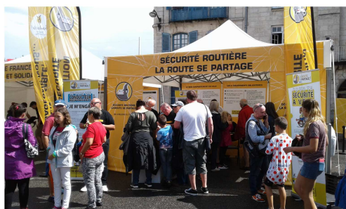
Stand Sécurité Routière lors du Tour de France